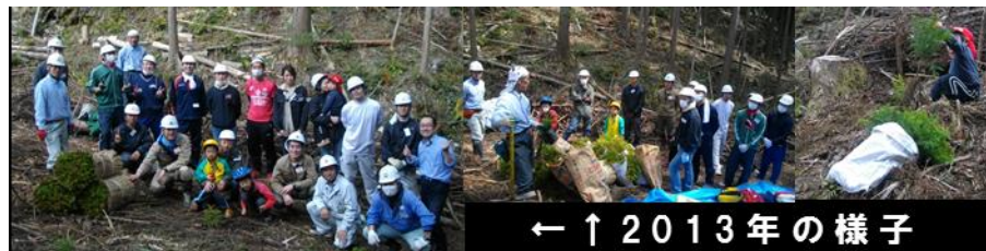
← ↑ 2013年の様子